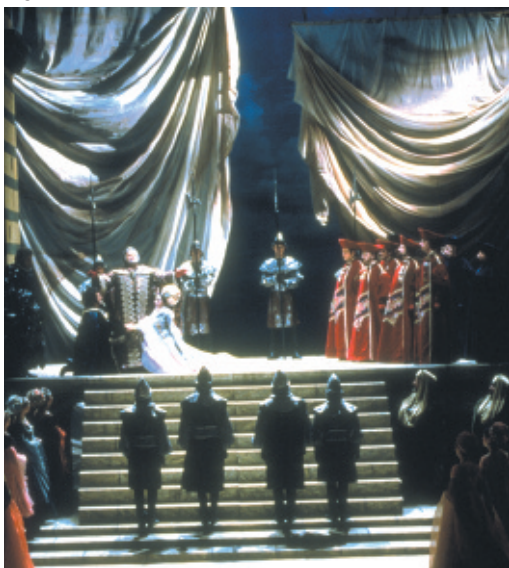
Bocca Negra - Opéra Royal de Wallonie - Photo D. Gaffé