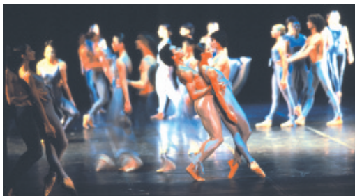
Light - Ballet du XXe siècle