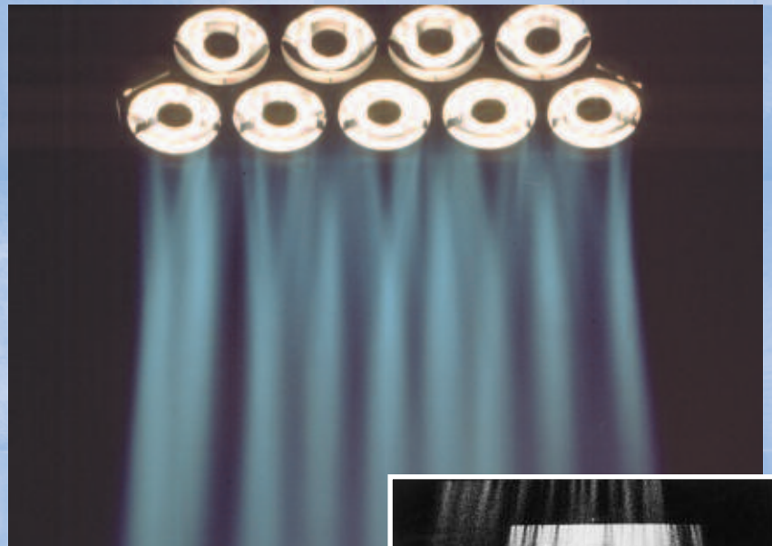
Le véritable "rideau de lumière"

Svoboda cherchait depuis longtemps un décor fait de lumière uniquement. Le résultat fut la SVOBODA, une herse de 2250 W ou 2500 W, composée de neuf ou dix lampes 24 V, produisant un faisceau extrêmement intense et presque parallèle, le "rideau de lumière". Utilisé en contre-jour, en douche ou comme éclairage frontal dur, la SVOBODA libère une lumière unique, douce et pourtant intense, qui crée une ambiance toute particulière.