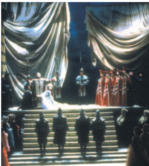
Bocca Negra - Opéra Royal de Wallonie - Photo D. Gaffé