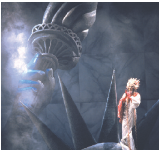
Caligula - Théâtre National de Belgique - Photo D. Gaffé