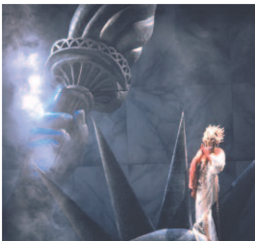
Caligula - Théâtre National de Belgique